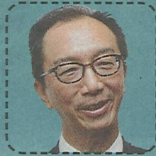
梁錦松 前財政司長