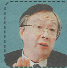
樂暉南 前民航處長