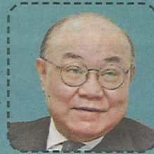
胡國興 前高等法院 上訴庭副庭長