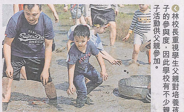
林校長重視學生父親對培養孩子的參與度，因此學校有不少親子活動供父親參加。

當然，這個貼士並非歧視「單親」或「爸爸忙於上班」的家庭。林校長指曾經有個家庭令她很感動，當時一位考生的父母因工作留在大陸，所以來見面的是考生的姑丈姑媽。「他們教育水平不太高，但他說：『我不是懂得很多，但會多帶他去圖書館！』我看到他們很花心機培養，一心希望小朋友有好的教育。」所以林校長說，面試問題怎會有前設呢！